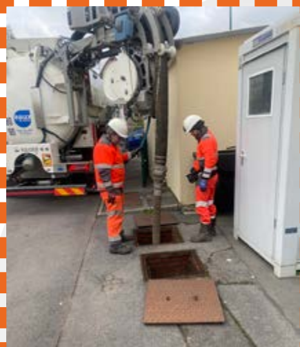
Curage des puisards et égoûts des salles communales