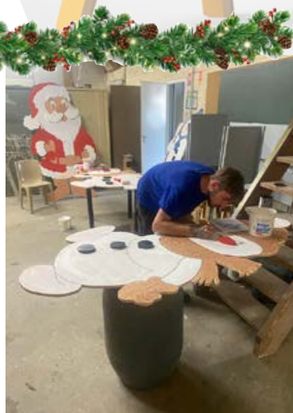
Rénovation, création, installation des décors et éclairages de Noël