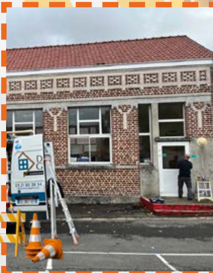
Pose de nouvelles menuiseries à l'école Curie

Rénovations, entretien, créations, sécurité améliorations du cadre de vie