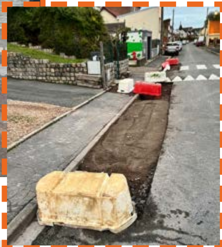
Rénovation d'enrobés rue Pablo Neruda, impasse Brasme et chemin d'Aix