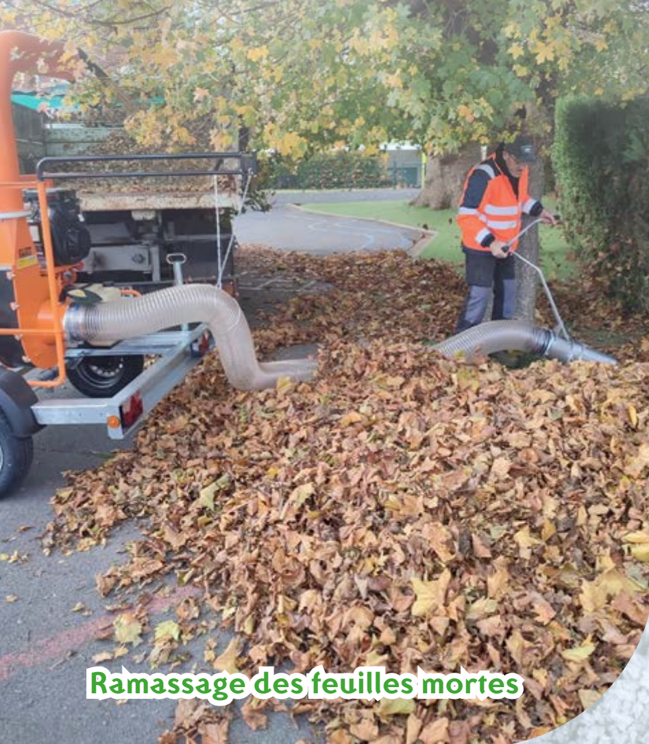
Ramassage des feuilles mortes

"Les arbres nus en hiver nous rappellent que même dans la simplicité, la beauté existe."