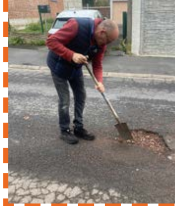
Rebouchage de nids de poule