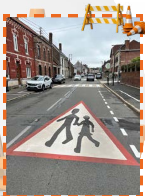
En plus de l'agent dédié à la traversée des routes aux abords des écoles, la sécurité a été renforcée par plusieurs marquages au sol