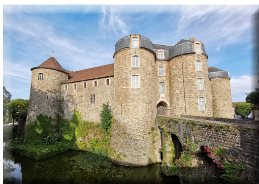
Visite du château et du musée de Boulogne-sur-Mer le matin